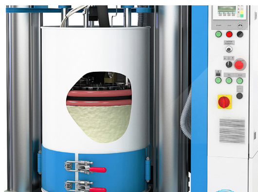
Werking Drum Melter