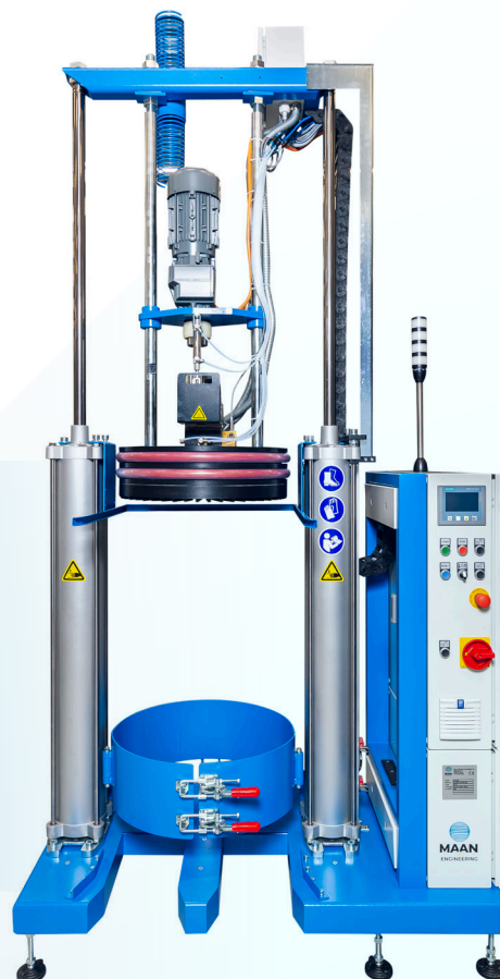
Drum Melter 200

Neem voor meer informatie contact met ons op, zodat we de machine naar uw wens kunnen configureren.